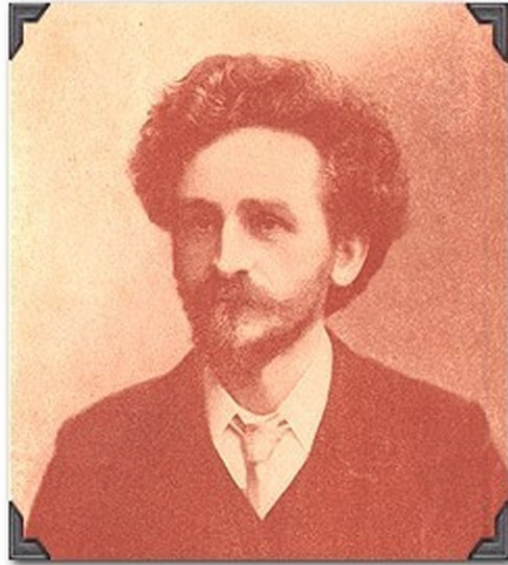
James Allen (1864-1912)